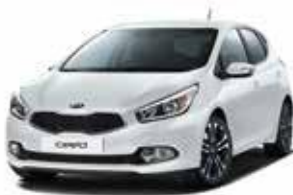
WD - Cassa White 1