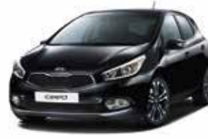
1K - Black Pearl 2