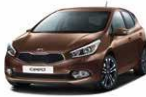
J5N - Matrix Brown 2