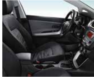
SILBER WK - Schwarz / Stoff