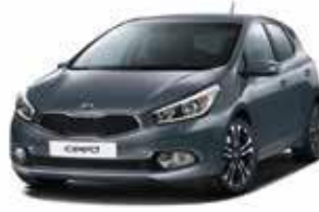
D7U - Planet Blue 2