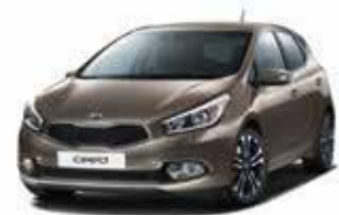
D5U - Sand Track 2