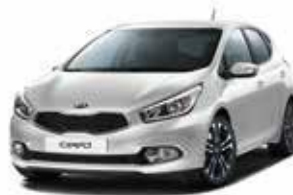
9S - Machine Silver 2