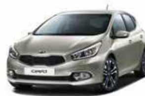
AA3 - Sirius Silver 2