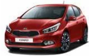
AA1 - Infra Red 2