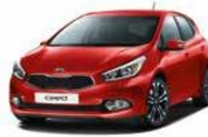
FRD - Track Red 1