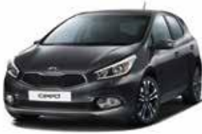
E5B - Dark Gun Metal 2