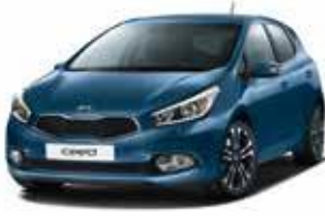
J3U - Space Blue 2