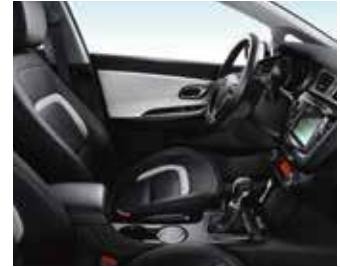
PLATIN WK - Schwarz / Volleleder