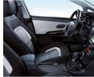
GOLD WK - Schwarz / Stoff